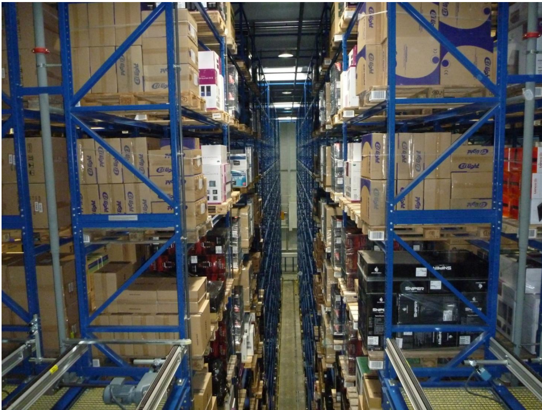
Noch freie Kapazität: eine von dreizehn Gassen im automatischen Hochregallager mit insgesamt 14'000 Palettenplätzen

sauerstoffreduziert, um das Brandrisiko zu minimieren. Weltweit gibt es nur 14 andere Autostore-Anlagen – die im Competec-Logistikzentrum ist bisher die grösste der Welt.