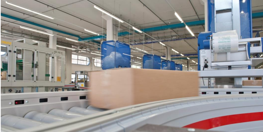
Ausgeklügelte Fördertechnik und automatische Paketkomprimierung: Der Warenausgang des Competec-Logistikzentrums